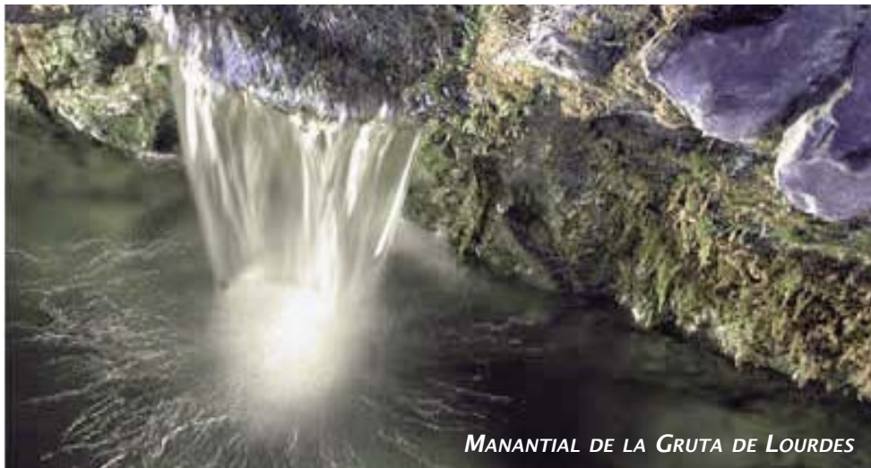
MANANTIAL DE LA GRUTA DE LOURDES