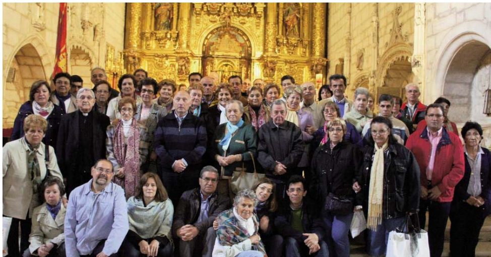
EL GRUPO DE LA HOSPITALIDAD EN LA COLEGIATA DE COVARRUBIAS, DURANTE LA ROMERÍA DEL PASADO 19 DE MAYO