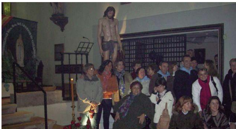
ENCUENTRO DE ORACIÓN EN LA IGLESIA DEL MONASTERIO DE «SANTA ISABEL DE HUNGRÍA»