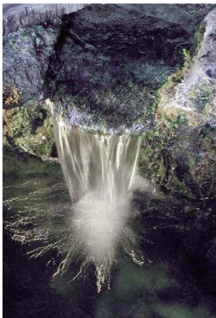
MANANTIAL DE LA GRUTA DE LOURDES

La vida de toda persona que lucha por ser coherente con su Bautismo, es decir, por ser santa, tiene sus tiempos de Cuaresma y Pasión, mediante las penitencias