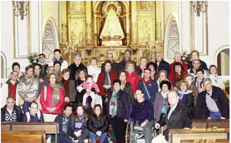
EL GRUPO DE LA HOSPITALIDAD EN LA ERMITA DE NUESTRA SEÑORA DE LAS VIÑAS DE ARANDA DE DUERO DURANTE LA VISITA A LAS EDADES DEL HOMBRE

Carta del señor Arzobispo La alegría de la conversión .2