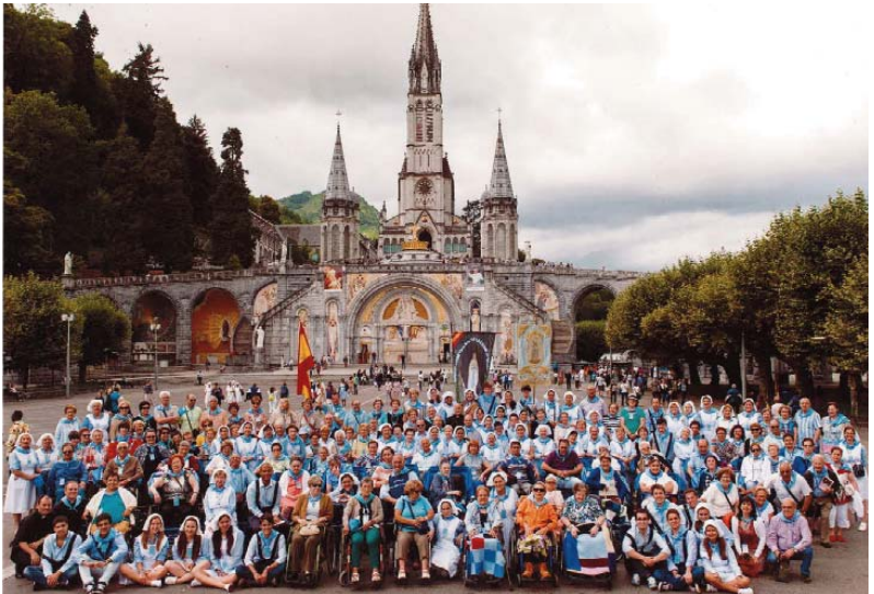
FOTO DE GRUPO DE LA PEREGRINACIÓN A LOURDES 2014

Carta del Consiliario Programación Pastoral Diocesana 2014-2015 ..... 2-3 Tesorería ..... 3 Pequeñas historias La Basílica de San Pío X, ¿por qué subterránea? .... 4-5