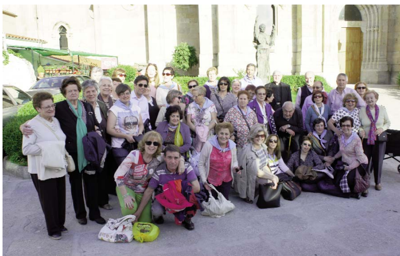
LOS PARTICIPANTES EN LA VISITA A LAS EDADES DEL HOMBRE EN ALBA DE TORMES

Carta de nuestro Cardenal Arzobispo..... 2