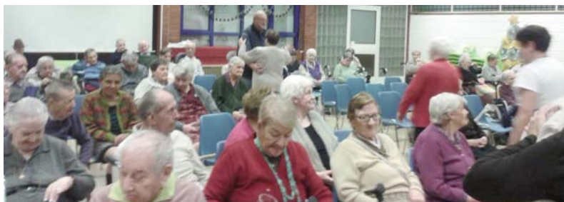
DOS MOMENTOS DE LAS VISITAS NAVIDEÑAS DE 2015