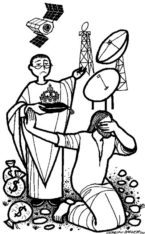
EL PASAJE DE LAS TENTACIONES, ILUSTRADO POR CEREZO BARRADO (WWW.SERVICIOSKOINONIA.ORG)

odio, la violencia gratuita de los soldados, la debilidad que lleva a Pilatos a obrar en contra de su conciencia, la emoción que no conduce a la conversión, la necesidad que nos hace bailar al son que tocan, la burla, la blasfemia. El Viacrucis podría ser, por tanto, un ejercicio y un momento propicios para vivir esta 2. a etapa de la peregrinación.