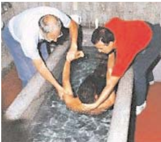
LAS PISCINAS DE LOURDES

7. Del 16 al 21 de septiembre se celebró la Peregrinación de 4000 matrimonios de cincuenta países, organizada y dirigida por los Equipos de Nuestra