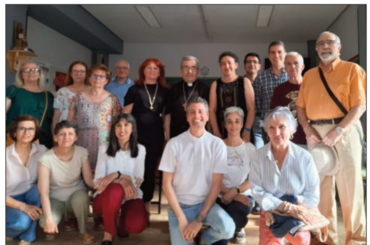
Don Luis Argüello, junto al párroco y feligreses de la Asunción de Nuestra Señora

En los distintos encuentros que compartió con jóvenes y con los grupos que colaboran en el día a día de la Parroquia lagunera, donde impartió el Sacramento de la Confirmación a casi medio centenar de personas, el prelado vallisoletano exhortó a todos a propiciar "momentos de encuentro para vivir la Fe juntos" y a elaborar "propuestas misioneras". "No mirando tanto las cifras", puntualizó, sino "anunciando a un Dios que nos ama y es Padre".