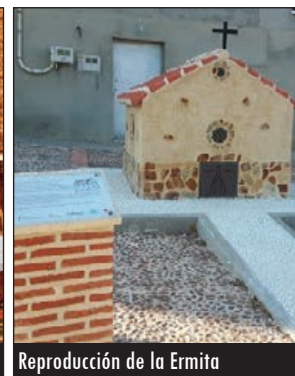
Reproducción de la Ermita