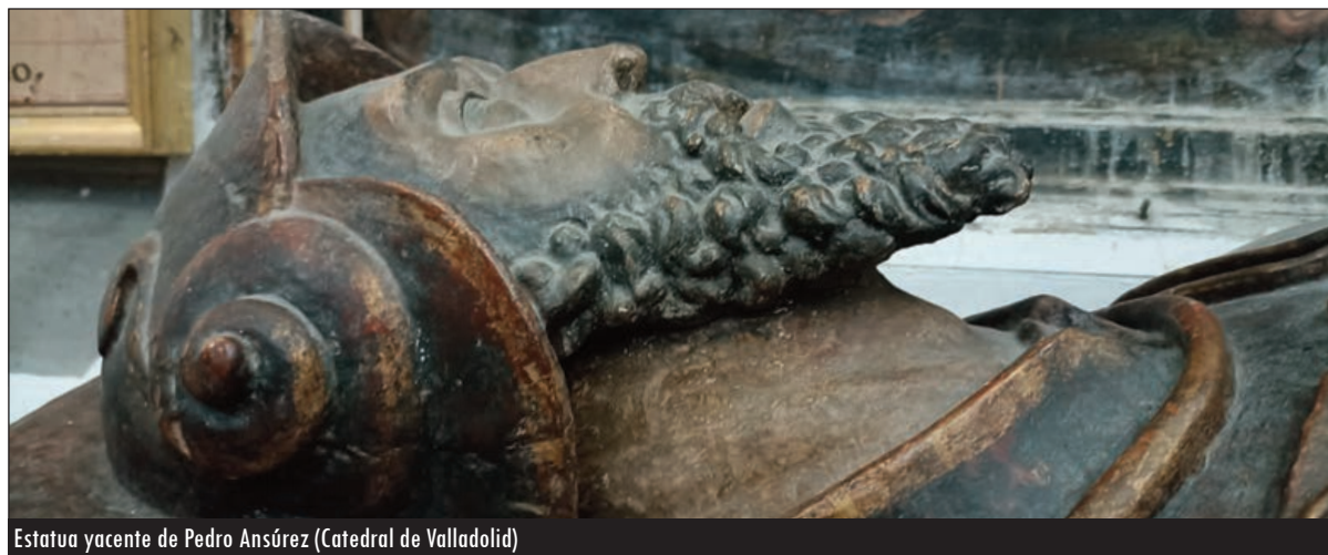
Estatua yacente de Pedro Ansúrez (Catedral de Valladolid)

Son pensamientos que pueden estar presentes mientras nos acercamos a su tumba, en la cabecera de la nave del Evangelio de la Catedral de Valladolid. Cuando se abrió la "Obra nueva" en el siglo XVII, se puso mucho empeño en el traslado de los restos del Conde, que habían estado bien situados en la antigua y segunda Colegiata, la propia del siglo XIII y que pro-