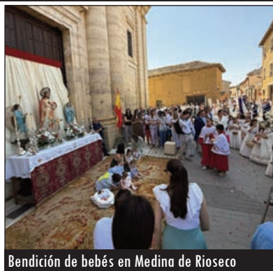
Bendición de bebés en Medina de Rioseco