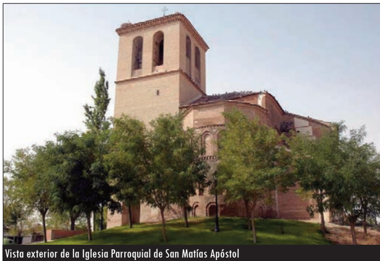
Vista exterior de la Iglesia Parroquial de San Matías Apóstol

Exteriormente, la Iglesia de San Matías Apóstol es digna de ver, pudiéndose ver sus hileras de arcos ciegos y frisos bellamente ornamentados, que ofrecen la magní-