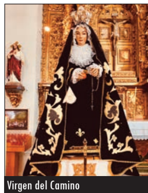
Virgen del Camino

La Virgen del Camino aún tiene camareras, una tradición que se ha ido transmitiendo de generación en generación, de abuelas a madres, de madres a hijas, que conservan la talla, sus ajueres y tienen siempre "a punto" a esta Virgen austera a la que los vecinos de la localidad y fieles foráneos siguen dirigiendo sus plegarias.