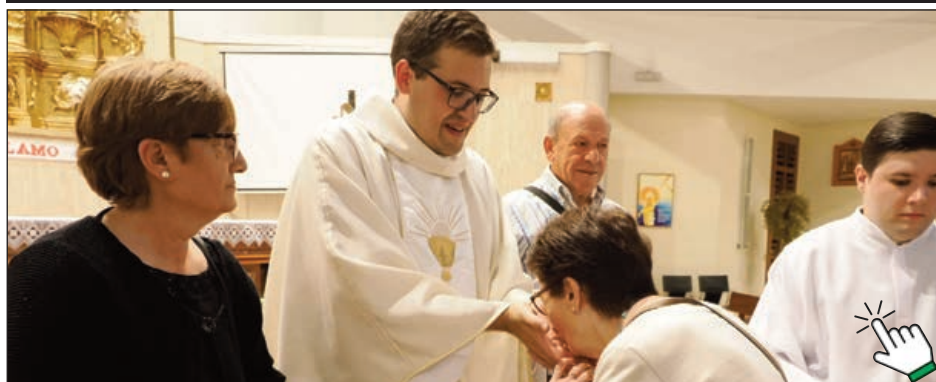
Los fieles le besan las manos en su primera Misa Solemne en la Parroquia San Vicente de Paúl, en Huerta del Rey

elección de hombres "varones" para "por la fuerza del Espíritu Santo" y la imposición de manos, ser fiel reflejo de Jesucristo entre todos nosotros a través del Sacramento del Orden. "Sacramento de Cristo Pastor, Sacramento de Cristo Esposo, Sacramento de Cristo Siervo" porque todos ellos reúnen una característica común: "dar la vida".