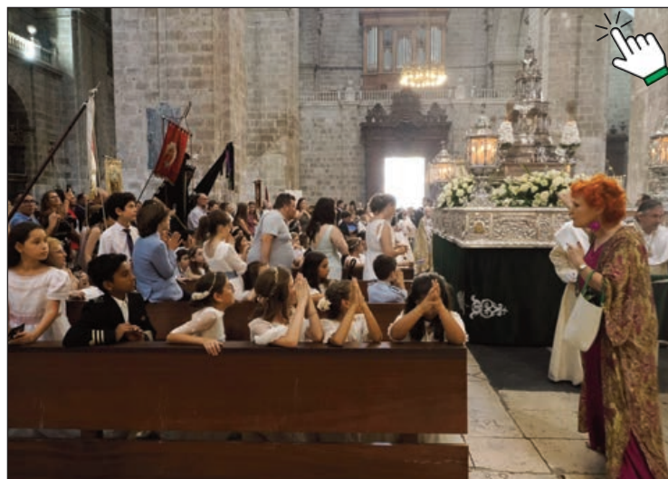
Niños de Primera Comunión arrodillados ante el paso de Su Divina Majestad

La Custodia fue abriéndose paso entre los fieles que la acompañaron durante todo el recorrido, pisando pétalos de flores y ramitas de romero al compas de las cornetas y los tam-