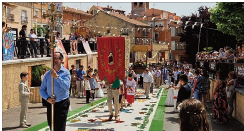
Procesión en Zarátán

Muchos municipios de la provincia de Valladolid engalanaron sus calles el pasado 22 de junio para que, cuando el Santísimo Sacramento saliera en procesión tras la celebración de la Eucaristía, los fieles pudieran adorar la presencia real de Jesucristo en la hostia consagrada al paso de las custodias ante altares efímeros, bajo palio o sobre las alfombras de flores propias de esta Solemnidad, la del Corpus Christi.