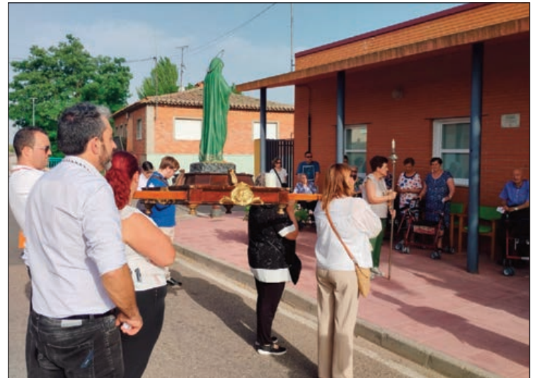
La Virgen de la Esperanza, a su llegada a la Residencia Reina Doña Urraca