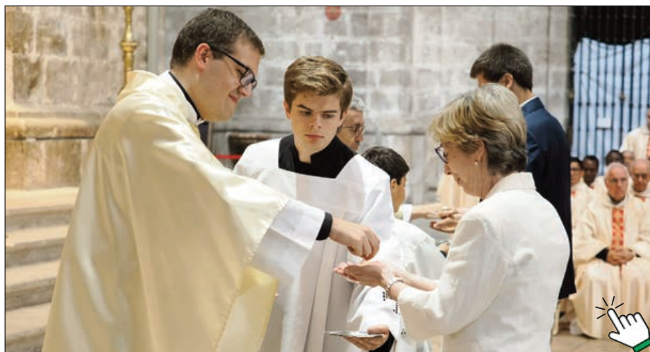
Distribuyendo la comunión