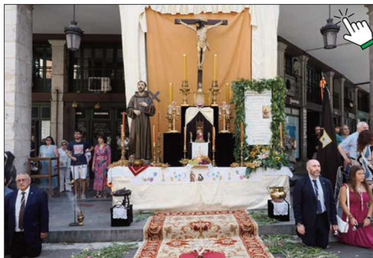
Altar de la Cofradía de la Orden Franciscana Seglar La Santa Cruz Desnuda

Camino fue más allá y animó a no quedarse sólo en el gesto de comulgar, sino en la "misión a los cercanos y a los lejanos" para "comunicar" la vivencia de la Eucaristía, que "nos hace eucaristías vivientes" y "crea una nueva fraternidad sin fronteras", concluyó.