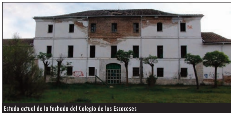
Estado actual de la fachada del Colegio de los Escoceses

Estos jóvenes escoceses se instalaron en el antiguo Colegio de San Ambrosio de la capital, donde hoy se levantan la Basílica-Santuario Nacional de la Gran Promesa y el Centro de Espiritualidad. Y, a su vez, en 1796, con su rector Cameron a la cabeza, compraron un caserón en Boecillo que restauraron y utilizaban especialmente en la época estival, donde además de contar con sala de estudio, zona deportiva... disponían también de una coqueta capilla.