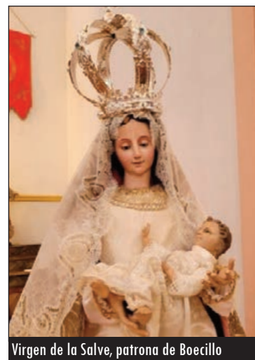
Virgen de la Salve, patrona de Boecillo

Definitivamente, se dio el paso de edificar una nueva iglesia sobre la anterior, encargándose de las obras el buen arquitecto diocesano Antonio Iturralde y el vitoriano, afincado en Valladolid, Jerónimo Ortiz de Urbina que, con un presupuesto total que rondaba las 100.000 pesetas, comenzaron a levantar la actual