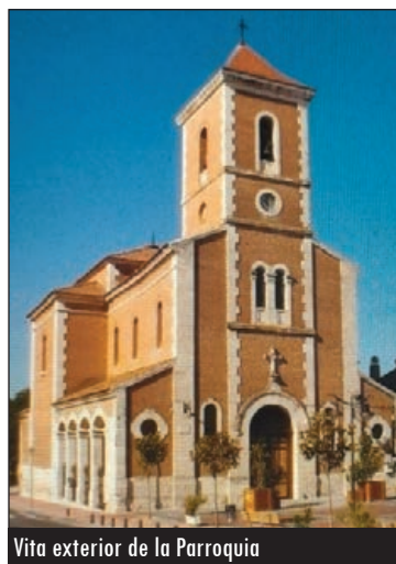
Vista exterior de la Parroquia

El templo tiene planta de cruz latina, con un bello crucero. El retablo mayor es barroco salomónico, de finales del siglo XVII, con una buena escultura de su titular, San Cristóbal, del siglo XVI; así como otras dos del XVIII, procedentes de la basílica románica de Cervatos (Cantabria), o una bella cruz parroquial, obra del jesuita Francisco de Isla —expuesta en el Museo Diocesano de Valladolid—. Se conservan también de la antigua iglesia un retablo del siglo XVII de buena calidad; y otro, en el lado del Evangelio, del XVI, en el que se representan escenas del Nuevo Testamento. También pueden contemplarse en la Iglesia Parroquial de San Cristóbal unos buenos oleos de santos benedictinos, atribuidos al pintor vallisoletano renacentista Pantoja de la Cruz.