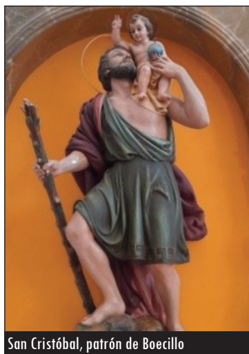
San Cristóbal, patrón de Boecillo

De estilo neoclásico, muy reformado, consta de una sola nave entre arcos de medio punto, está cubierta con bóveda de cañón con lunetos y cúpula sobre el crucero. El coro alto se sitúa a los pies, al igual que el acceso al templo por una portada con arco de medio punto. En su interior son venerados la Virgen de la Salve, patrona de la localidad, San Cristóbal, su patrón, y el Santo Cristo de Boecillo, así como otras obras de arte de los siglos XVI, XVII y XVIII.