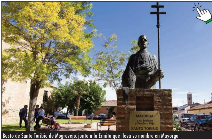
Busto de Santo Toribio de Mogrovejo, junto a la Ermita que lleva su nombre en Mayorga

C on gran alegría” recibieron en Mayorga, su tierra natal, la concesión a la Archidiócesis de Valladolid de un Año Jubilar para celebrar en 2026 el tercer centenario de la canonización de Santo Toribio de Mogrovejo.