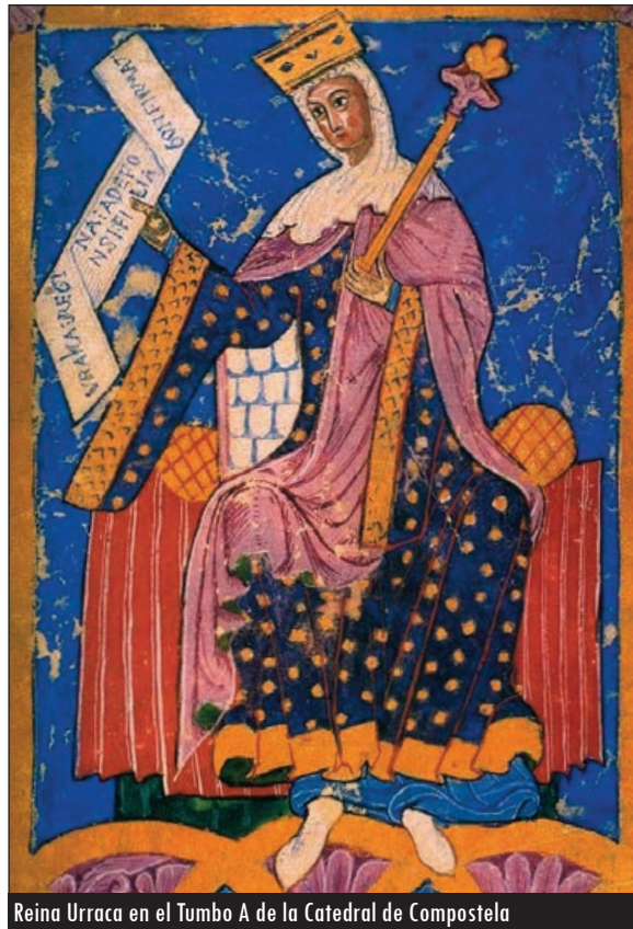
Reina Urraca en el Tumbo A de la Catedral de Compostela