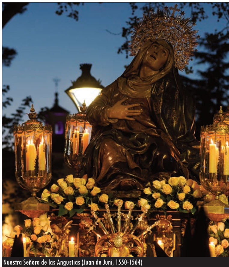
Nuestra Señora de las Angustias (Juan de Juni, 1550-1564)

Amigos, que esta misión de la Virgen de las Angustias nos llame a todos nosotros a vivir un año también de testimonio misionero y que, haciéndolo, avancemos en el camino de la santidad, porque en la entrega de la vida, en el testimonio de nuestra fe, vamos edificando ese pueblo santo de Dios que quiere ofrecer a nuestros vecinos la alegría que brota de la misericordia del Corazón de Cristo y que su madre, Virgen de las Angustias, nos la ofrece como cauce privilegiado para el encuentro con su Hijo Jesús.