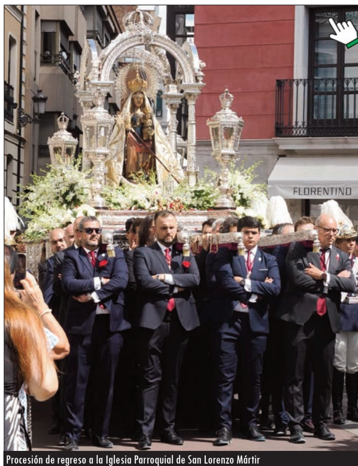
Procesión de regreso a la Iglesia Parroquial de San Lorenzo Mártir