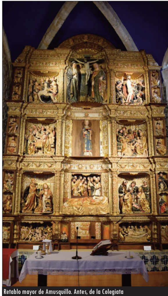
Retablo mayor de Amusquillo. Antes, de la Colegiata