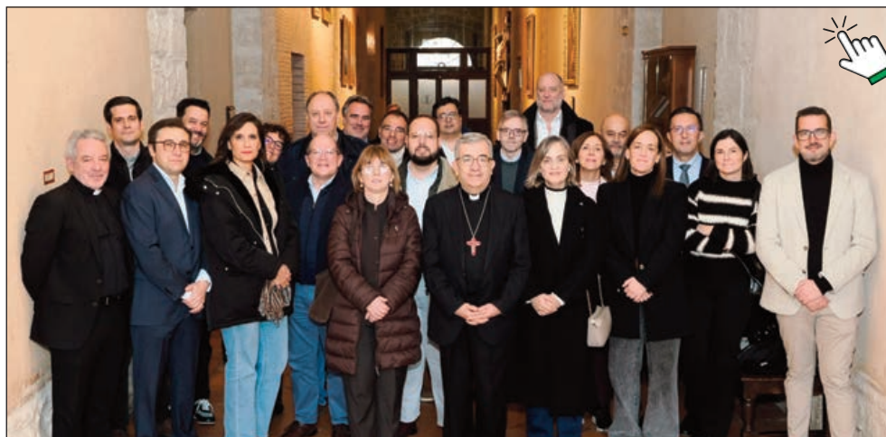
El 22 de enero el Arzobispo de Valladolid compartió una comida fraternal con profesionales de los medios de comunicación, como es tradición, en los días previos a su patrón, San Francisco de Sales

E l Santuario Nacional de La Gran Promesa fue inaugurado en el año 1941 y el 12 de mayo de 1964 el Papa Pablo VI concedió al templo el título de Basílica menor. El Centro Diocesano de Espiritualidad (CDE) se constituyó el 28 de septiembre de 1994 como un lugar de acogida, descanso, oración y formación, donde encontrarse con Dios, con uno mismo, con los demás. Ambos son lugares de paz en el corazón de Valladolid.