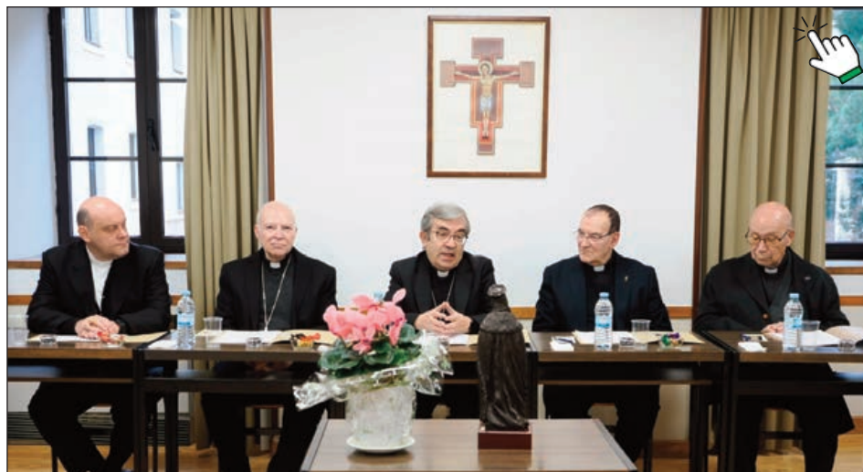
Reunión con la Comisión Isabel la Católica