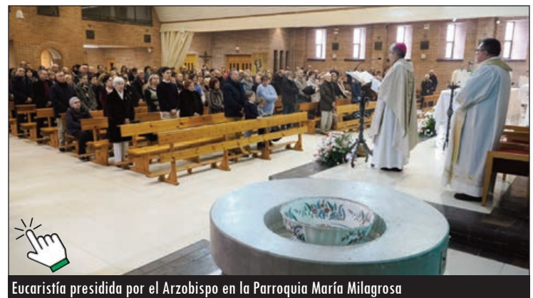
Eucaristía presidida por el Arzobispo en la Parroquia María Milagrosa

Actualmente, en Valladolid viven 17 Teresianas en sus dos comunidades de Felipe II y el barrio Belén.