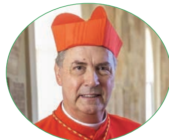
Ángel Fernández Artime

Cardenal. Este salesiano, desde 2024 pro-prefecto del Dicasterio para los Institutos de Vida Consagrada y las Sociedades de Vida Apostólica y vinculado a Valladolid, en cuya Universidad estudió Filosofía, suma un nuevo cargo de responsabilidad en La Santa Sede. El pasado 21 de enero, el cardenal Artime fue nombrado por el Papa León XIV nuevo miembro de la Comisión Cardenalicia que supervisa las labores del Instituto para las Obras de Religión (IOR), fundado por el Papa Pío XII, el popularmente conocido como Banco Vaticano