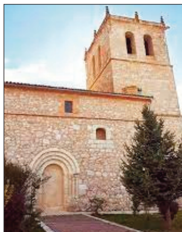
Vista exterior de la Iglesia

En Canalejas, las tradiciones religiosas giran en torno a su patrona, la Virgen del Olmar, con fiestas en su honor que incluyen una romería a su ermita, en el mes de julio, con la tradicional subasta de andas y su subida al trono durante las fiestas patronales, donde la imagen permanece hasta agosto. Estas costumbres, como la ro-