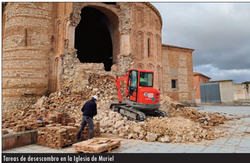
Tareas de desescombro en la Iglesia de Muriel

En menos de una semana, por debajo del plazo inicialmente previsto por la Delegación de Patrimonio y Obras del Arzobispado de Valladolid, culminaron las tareas de desescombro tras el colapso del ábside de la Iglesia Parroquial de Santa María del Castillo, en Muriel de Zapardiel, ocurrido el pasado 12 de enero.