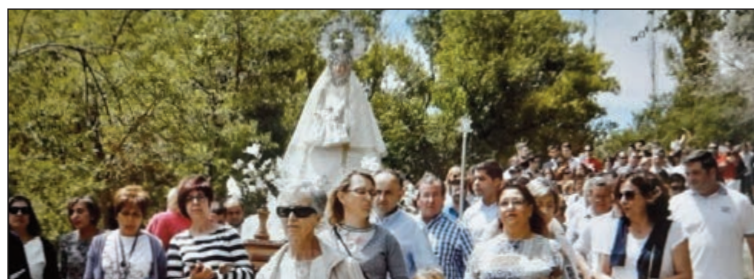
Romería en honor a la Virgen del Olmar

mería y las celebraciones de la Virgen, son el corazón de la vida local, donde se mezcla la fe con la cultura popular y de ello hacen comunidad.