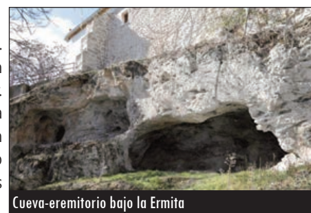
Cueva-eremitorio bajo la Ermita

En el subsuelo hueco de esta ermita-sede de la patrona de Canalejas de Peñafiel, se encuentra la conocida como "Cueva-Eremitorio del Olmar". Aquellos eremitas que habitaron en esta cueva-eremitorio del Olmar eran de la Alta Edad Media. Y, justamente, en este lugar encontraron el lugar ideal para la meditación, el recogimiento y la paz interior en su acercamiento con Dios. En el interior de la mencionada cueva-eremitorio, se hallan varias tumbas antropomorfas talladas en piedra.