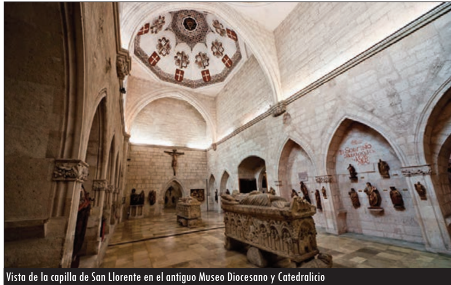
Vista de la capilla de San Llorente en el antiguo Museo Diocesano y Catedralicio

Una vez pasada esta entrada se podía acceder a la capilla de Santa Bárbara, que será la primera del futuro Museo Catedralicio. Ya