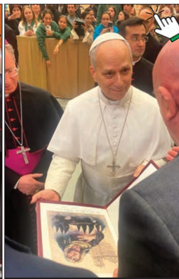
Momento de la entrega del cartel

Valladolid, "le hemos invitado a visitar nuestra tierra".