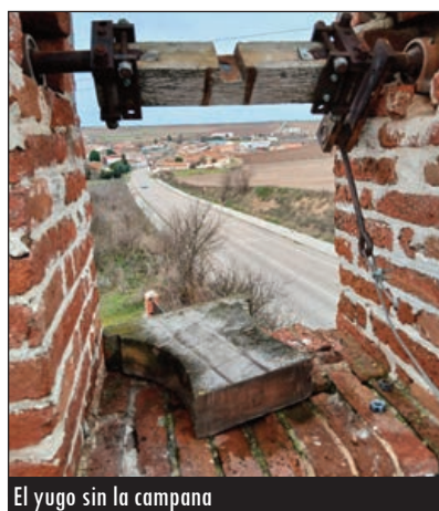
El yugo sin la campana

Al cierre de la edición de este número de IEV se desconocía la autoría del robo, así como la fecha exacta en la que pudo producirse, aunque el párroco de la localidad apunta a una posible horquilla de tiempo entre los días 4 y 5 del mismo mes. El responsable o responsables del