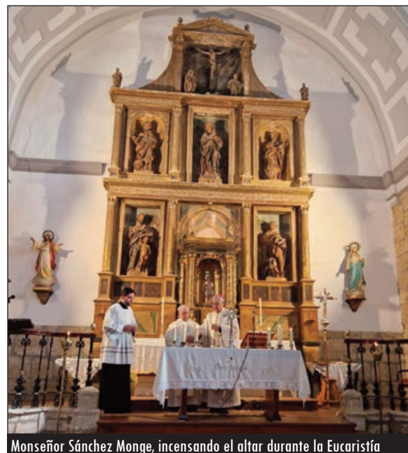
Monseñor Sánchez Monge, incensando el altar durante la Eucaristía

Unos 80 fieles —se superó con creces cualquier previsión— participaron en el año de su recuperación en esta celebración, que mira ya con ilusión renovada al 2027.