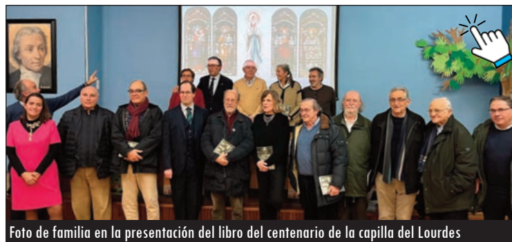
Foto de familia en la presentación del libro del centenario de la capilla del Lourdes

Durante la presentación, que reunió de nuevo en el Colegio a varias generaciones de antiguos alumnos, Burrieza destacó la sencillez de este proyecto que, al mismo tiempo, fue posible "gracias al apoyo de muchas