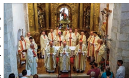
Primera misa de Bocos como cardenal, en Canillas

Una extensa vida, la del cardenal Bocos, consagrada al servicio de la Iglesia y al de su Orden claretiano, donde ha realizado con diligencia múltiples encomiendas, sobresaliendo su labor como Superior General.