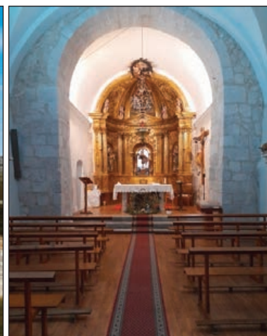
Interior de la Iglesia

de la portada y la riqueza de su iconografía en los capiteles, reflejando así la influencia del románico tardío en la región.