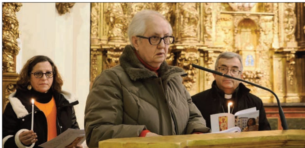
Vigilia de oración y reflexión contra la trata de personas y la explotación con fines sexuales y laborales, celebrada en la Capilla de la Congregación el pasado 4 de febrero. Con presencia de la CEE y las Oblatas del Centro Albor

E l Santuario Nacional de La Gran Promesa fue inaugurado en el año 1941 y el 12 de mayo de 1964 el Papa Pablo VI concedió al templo el título de Basílica menor. El Centro Diocesano de Espiritualidad (CDE) se constituyó el 28 de septiembre de 1994 como un lugar de acogida, descanso, oración y formación, donde encontrarse con Dios, con uno mismo, con los demás. Ambos son lugares de paz en el corazón de Valladolid.