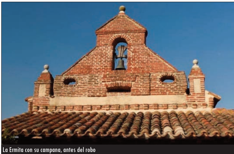
La Ermita con su campana, antes del robo